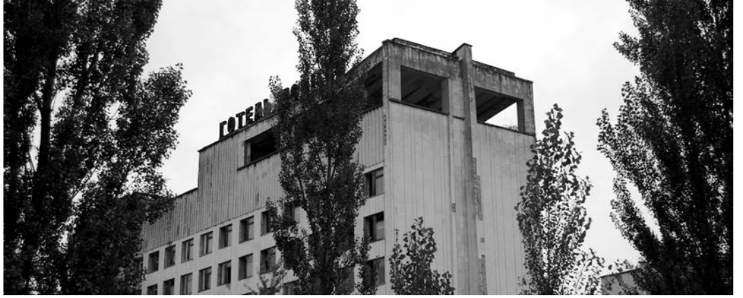
Tšernobylin vihreä luonto todistaa kapitalistisen median vuonna 1986 levittämät onnettomuushuhut valheelliseksi propagandaksi.

Ylennetään tykkimieheksi, myönnetään Paavo Väyrynen -kunniamerkki ja ostolupa 20 kg ämpärille vaseliinia tulevaisuuteen viisivuotiskaukeksi.